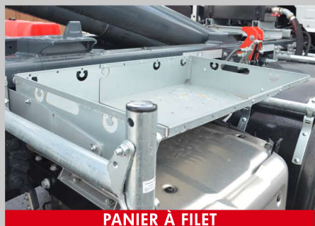
PANIER À FILET