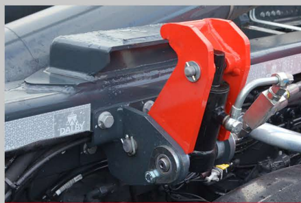
VERROUILLAGE HYDRAULIQUE AVANT