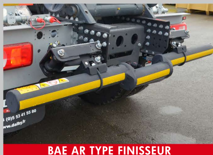
BAE AR TYPE FINISSEUR