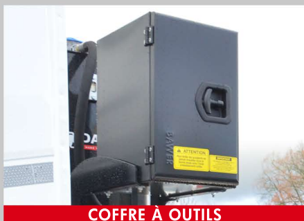
COFFRE À OUTILS