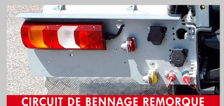
CIRCUIT DE BENNAGE REMORQUE

Intéressé par ce produit ! Contactez nous par téléphone au 05 53 41 55 81 ou par mail : commercial@dalby.fr