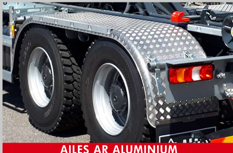
AILES AR ALUMINIUM