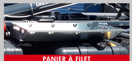
PANIER À FILET