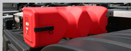
EXTINCTEUR 6 KG DANS COFFRE PVC

Intéressé par ce produit ! Contactez nous par téléphone au 05 53 41 55 81 ou par mail : commercial@dalby.fr