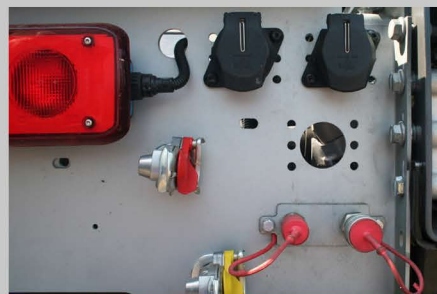
CIRCUIT DE BENNAGE REMORQUE