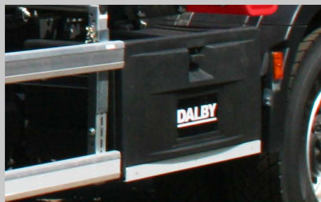
COFFRE À OUTILS