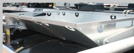
PANIER À FILET