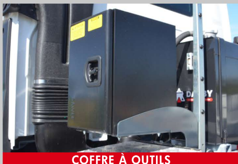
COFFRE À OUTILS