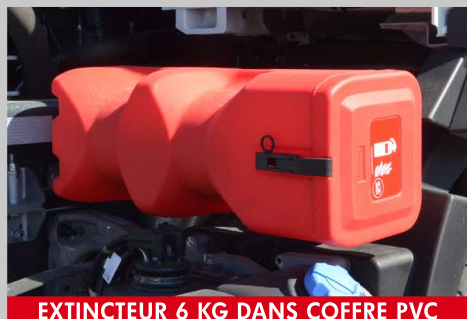
EXTINCTEUR 6 KG DANS COFFRE PVC