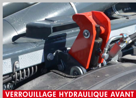
VERROUILLAGE HYDRAULIQUE AVANT