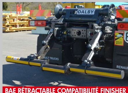
BAE RÉTRACTABLE COMPATIBILITÉ FINISHER