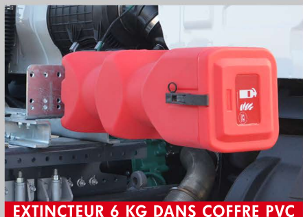
EXTINCTEUR 6 KG DANS COFFRE PVC