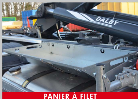
PANIER À FILET